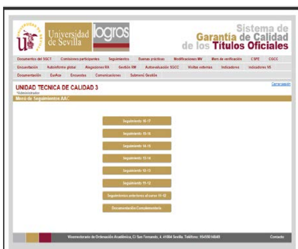
Autoinforme de Seguimiento

Dentro del plazo establecido por la AAC, el Vicerrectorado competente en la materia fijará el plazo para la elaboración por parte del Centro del autoinforme, ya sea de seguimiento o de renovación de la acreditación, así como para la definición del plan de mejora, que habrá de ser aprobado por la Junta de Centro.