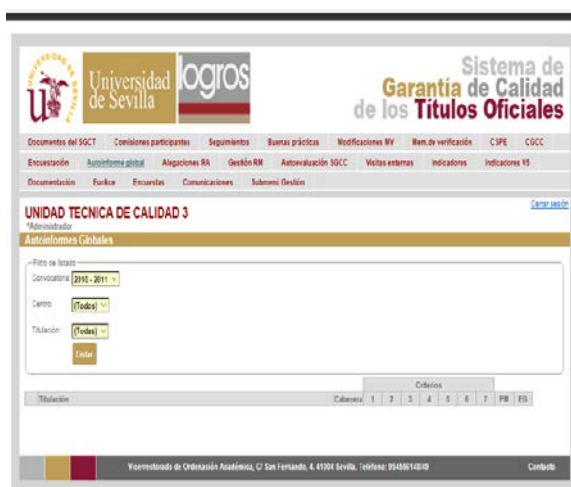
Autoinforme Global de Renovación de la Acreditación

En el caso del seguimiento, dentro de dicho plazo, la CGCC realizará un análisis de los indicadores, procedimiento a procedimiento, reflexionando sobre las fortalezas y debilidades detectadas, e identificando las áreas de mejora. Para ello deberá considerar los tres tipos de indicadores que podrán ser: