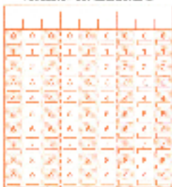
Teléfono (voluntario) a efectos de validación del cuestionario